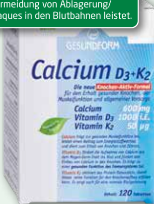
Gesundform Calcium D3 + K2 120 Tabletten

Enthält zusätzlich zum Vitamin D 3 auch das Vitamin K 2 , das einen wesentlichen Beitrag zur Vermeidung von Ablagerung/Plaques in den Blutbahnen leistet.