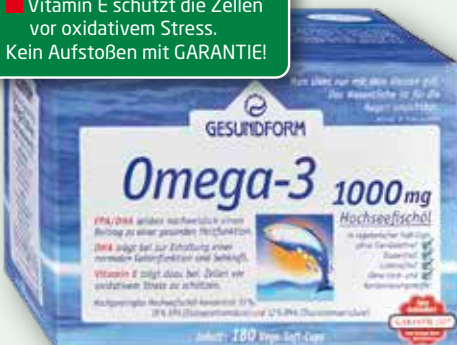
Gesundform Omega-3 1000 mg Hochseefischöl 180 Vega-Soft-Caps

■ Omega-3 unterstützt Herz, Gehirn und Sehkraft. ■ Vitamin E schützt die Zellen vor oxidativem Stress. Kein Aufstoßen mit GARANTIE!