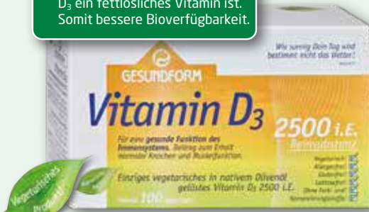
Gesundform Vitamin D 3 2500 i.E. 100 Vega-Caps

■ Unterstützt die gesunde Funktion des Immunsystems. ■ Gelöst in nativem Olivenöl, da D 3 ein fettlösliches Vitamin ist. Somit bessere Bioverfügbarkeit.