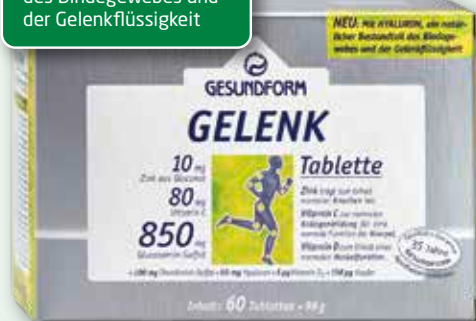
Gesundform Gelenk 850 mg 60 Tabletten

NEU: Mit HYALURON, ein natürlicher Bestandteil des Bindegewebes und der Gelenkflüssigkeit