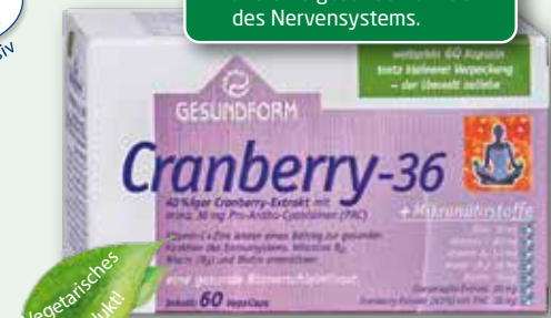
Gesundform Cranberry-36 60 Vega-Caps

■ Mit Vitamin B 2 + B 3 für eine gesunde Blasenschleimhaut ■ und eine gesunde Funktion des Nervensystems.